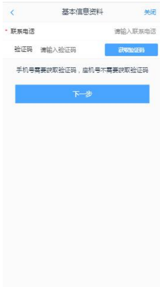
图 7 联系电话修改