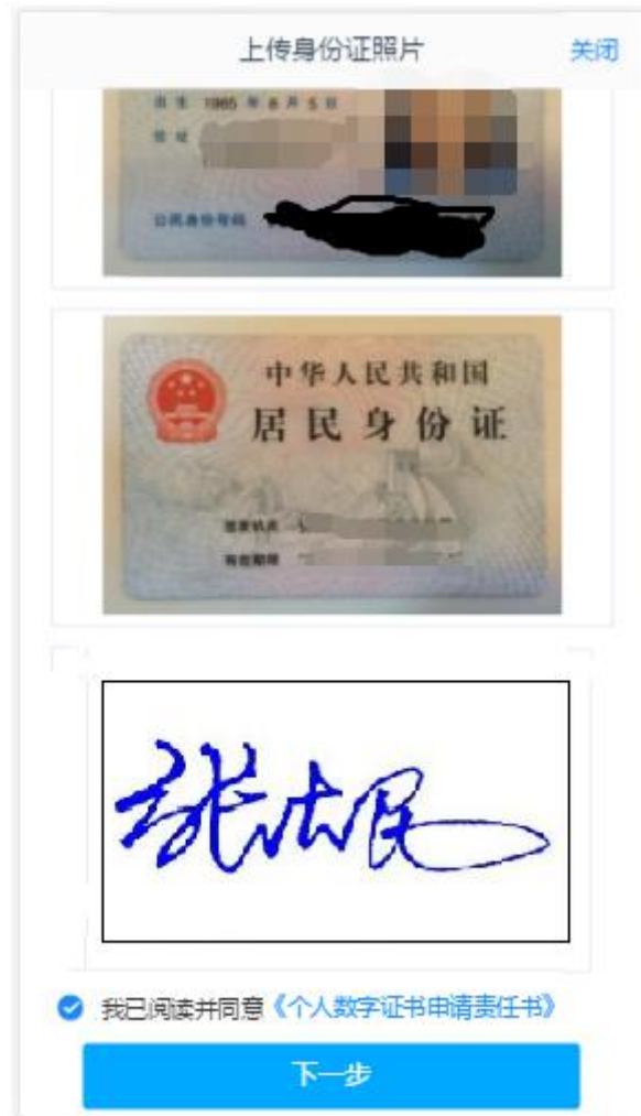
图 5 期货开户云 app 上传身份证界面

进入到上传照片页面，页面图片会根据客户开户时上传的照片进行回显，也可以重新上传，如图 5 所示。如客户办理身份证有效期修改，则需重新上传证件照及签名照。