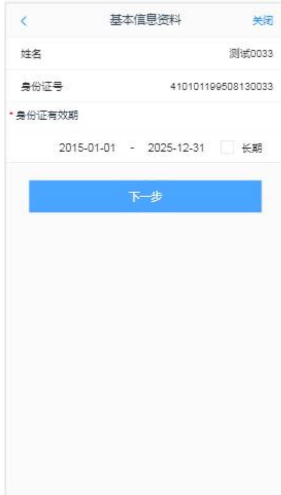
图 6 身份证有效期修改

进入身份证有效期修改页面，如图 6 所示，“*”为必填项，姓名和身份证号不允许修改，修改证件有效期，也可勾选“长期”，默认为 2099-12-31，若之前就是 2099-12-31，“长期”会自动勾选。点击“下一步”，进入协议签署页面。