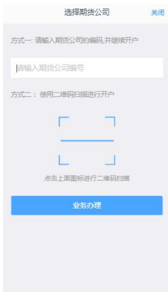
图 1 期货开户云 app 输入期货公司编号页

1、打开开户云 app，登录以后会出现如图 1 所示的页面，直接在输入框输入期货公司编号 0038 进行业务办理