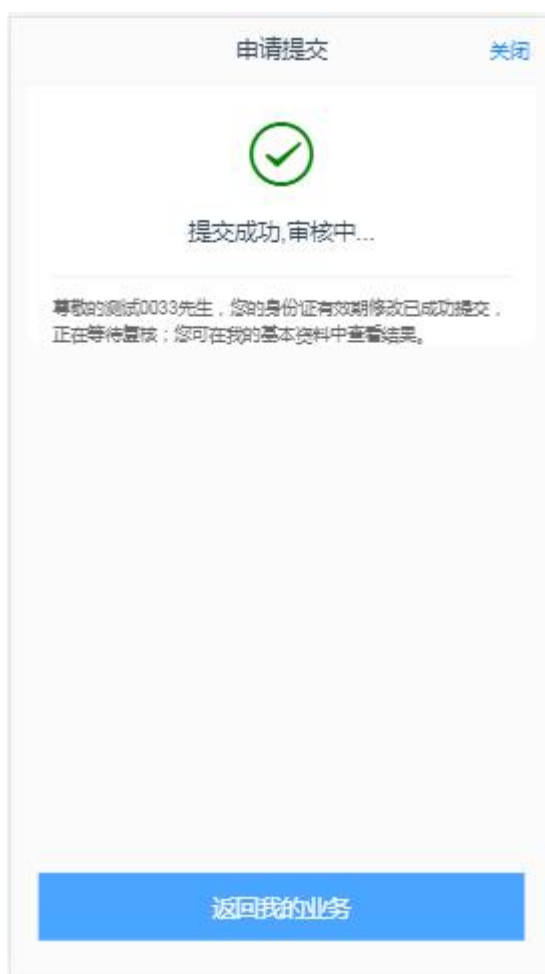
图 10 我的基本资料申请提交