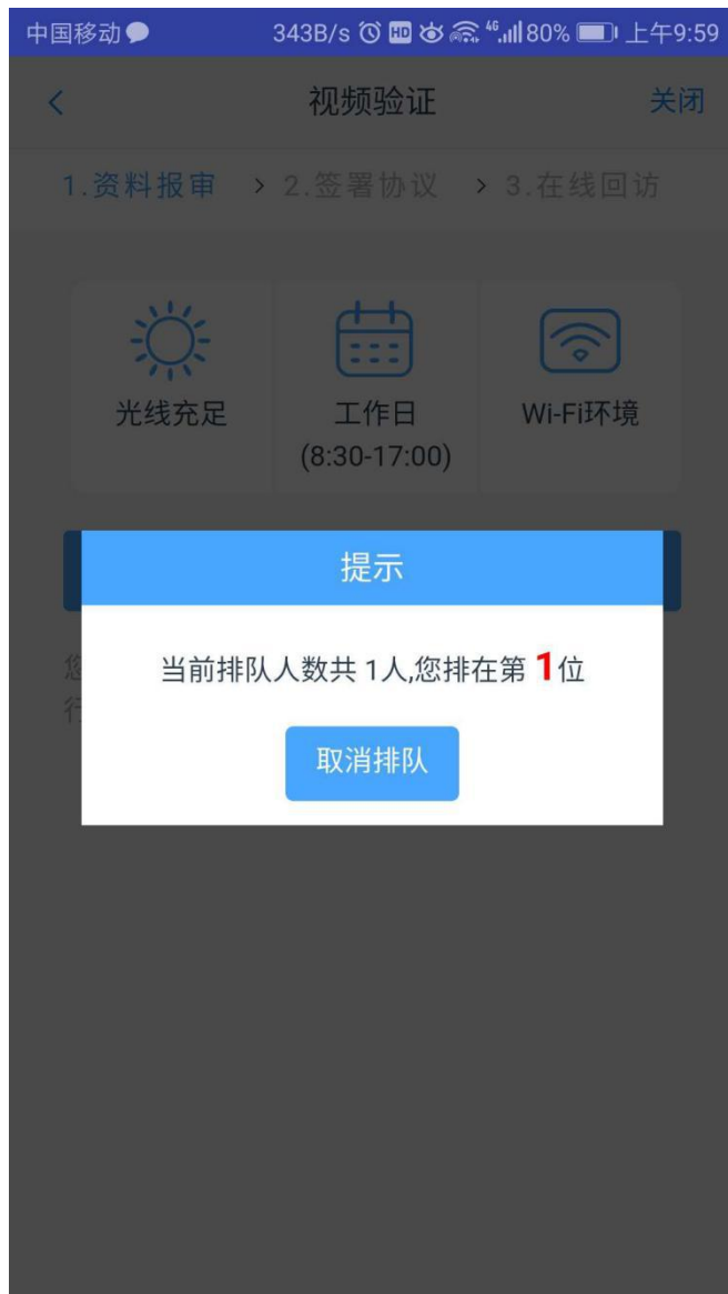
图 13 视频排队