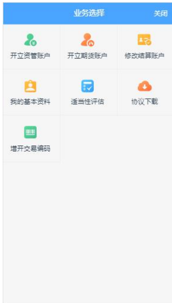
图 2 期货开户云 app 业务选择页面