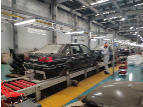
图表 9：华仁汽车拆解线