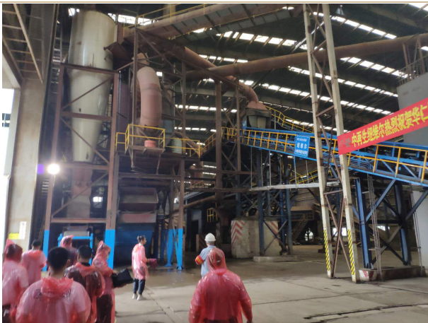
图表 12：6000 马力破碎线