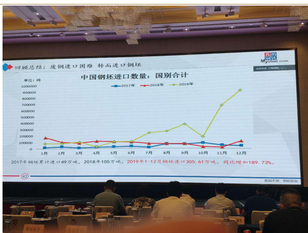
图表 3：2019 年中国钢坯进口量

中国废钢进口困难，转而进口钢坯，2019 年中国钢坯进口量显著增加。同时就国内废钢加工企业而言，受疫情影响，2020 年 1-3 月废钢产量同比大幅下降。但实际上废钢的社会积蓄量在增加。