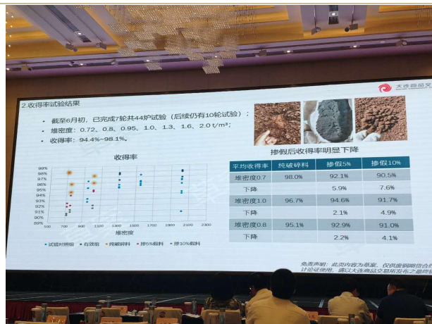
图表 2：收得率试验结果