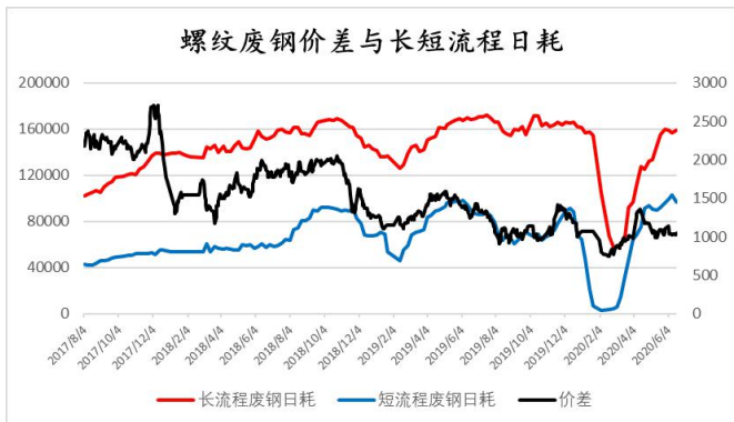
图表 5: 螺废价差与长短流程日耗 (万吨、元)