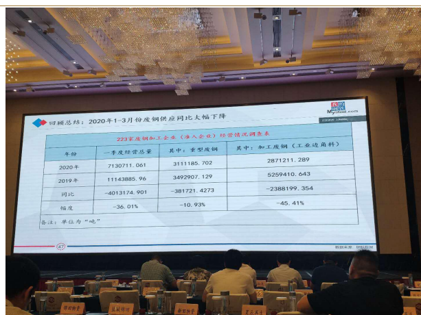
图表 4：2020 年 1-3 月废钢加工量