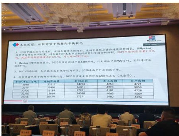
图表 7: 废钢供需展望