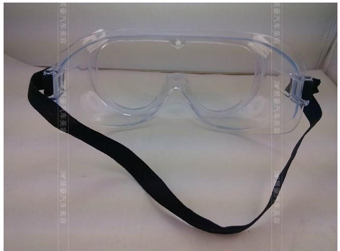
图表 2：PET 用于护目镜