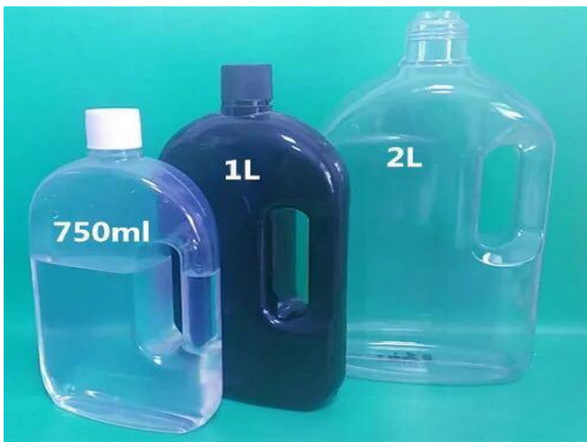
图表 1：PET 用于消毒液

目前国企上游工厂短纤满负荷生产，对于央企本身也有满产满销的要求。加工利润在年初亏损，但目前较为可观。瓶片销售也好于往年，防护领域如护目镜、消毒液等增加了瓶片的需求。企业短纤销售形式9成为合约货，销售价格以CCF价格为参考依据。未来企业看好包装需求以10%的速度增长，但瓶片产能扩张可能并不及预期，市场仍然会处于相对平衡状态。