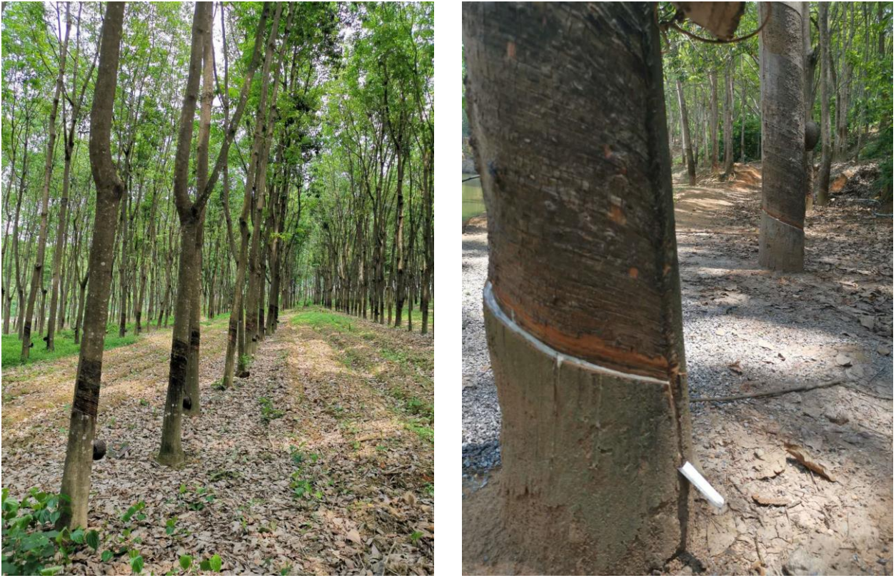
图表 7：国营胶厂 B