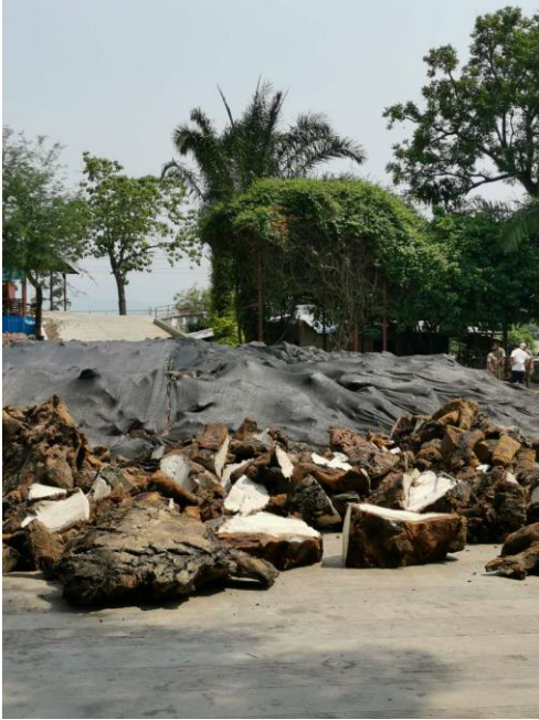
图表 5：国营胶厂 A