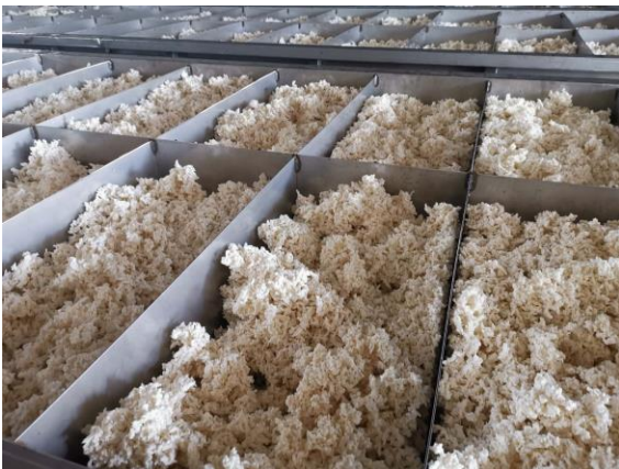
图表 6：国营胶厂 A

工厂往年 4 月份就开始加工，今年到现在还没怎么开始，主要产品包括全乳、9710、10 号胶，STR20，反应收不到胶，预估今年版纳减产 30%左右。